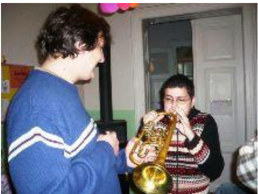
Setkání s muzikou